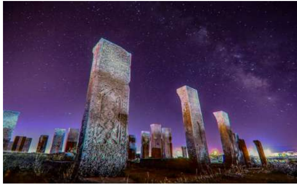
Fatih Yılmaz 1