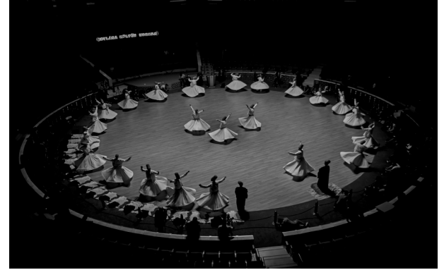
Derya Yazar 2