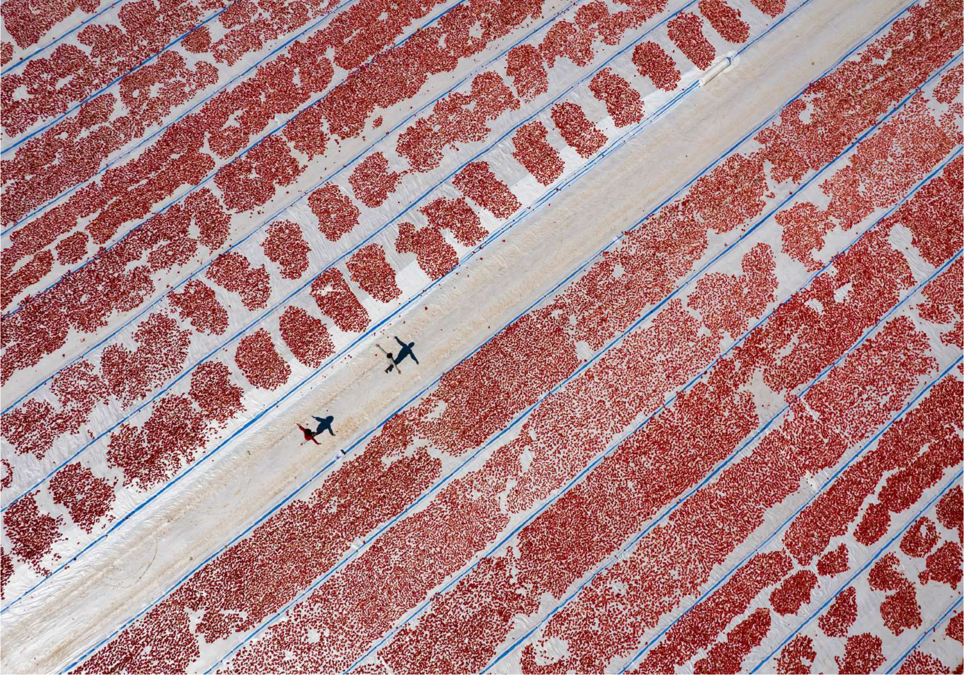
DRONE ÖDÜLÜ Yakup Sayak